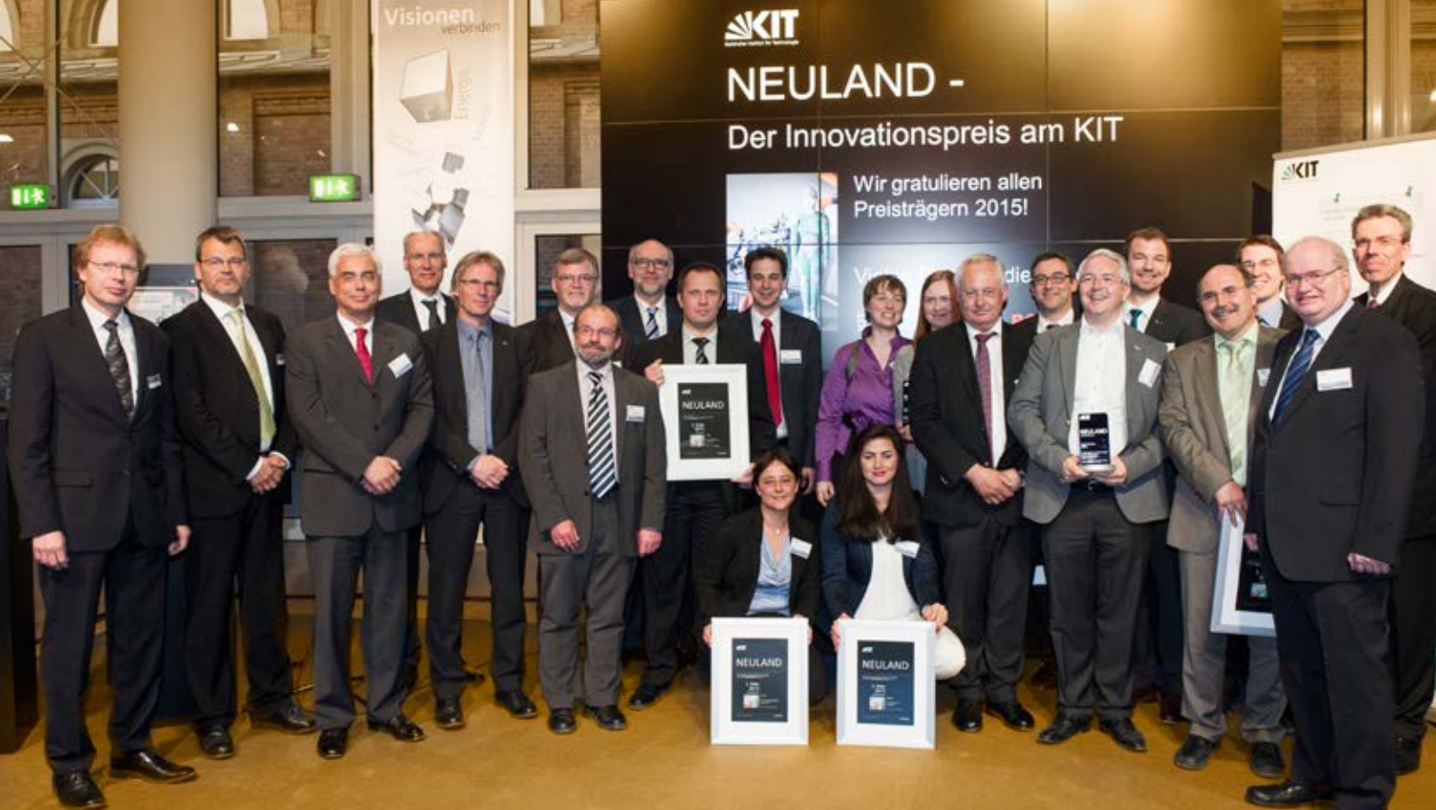
Alle Preisträger des Innovationswettbewerbs 2015 zusammen mit dem KIT-Präsidenten, der Wettbewerbsjury und den Betreuern vom KIT-Innovationsmanagement.

„Technologische Ideen und das Wissen, was dem Kunden einen tatsächlichen Nutzen bringt, sind für mich zwei wichtige Voraussetzungen, um erfolgreiche Produkte zu entwickeln und als Technologieführer ganz vorn mit dabei zu sein. Das KIT als Brutstätte technologischer Ideen und als Brückenbauer zwischen Forschung und Wirtschaft kann uns hier wertvolle Impulse liefern.“